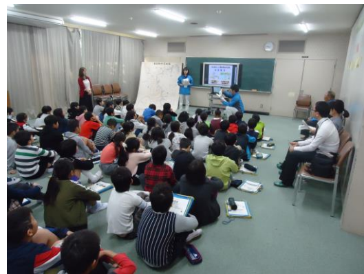
水土里ネット愛知用水の出前授業