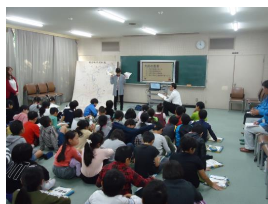
大府市農政課の出前授業