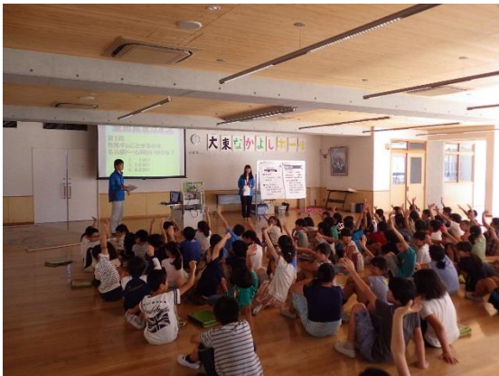
水土里ネット愛知用水の出前授業

また、後日行ったアンケートでは、「クイズがたくさんあって楽しかった。」「愛知用水を作るための地図が3ヶ月で完成するなんてびっくりしました!」などと、愛知用水や大府市の農業について楽しく学べたのではないかと思います。